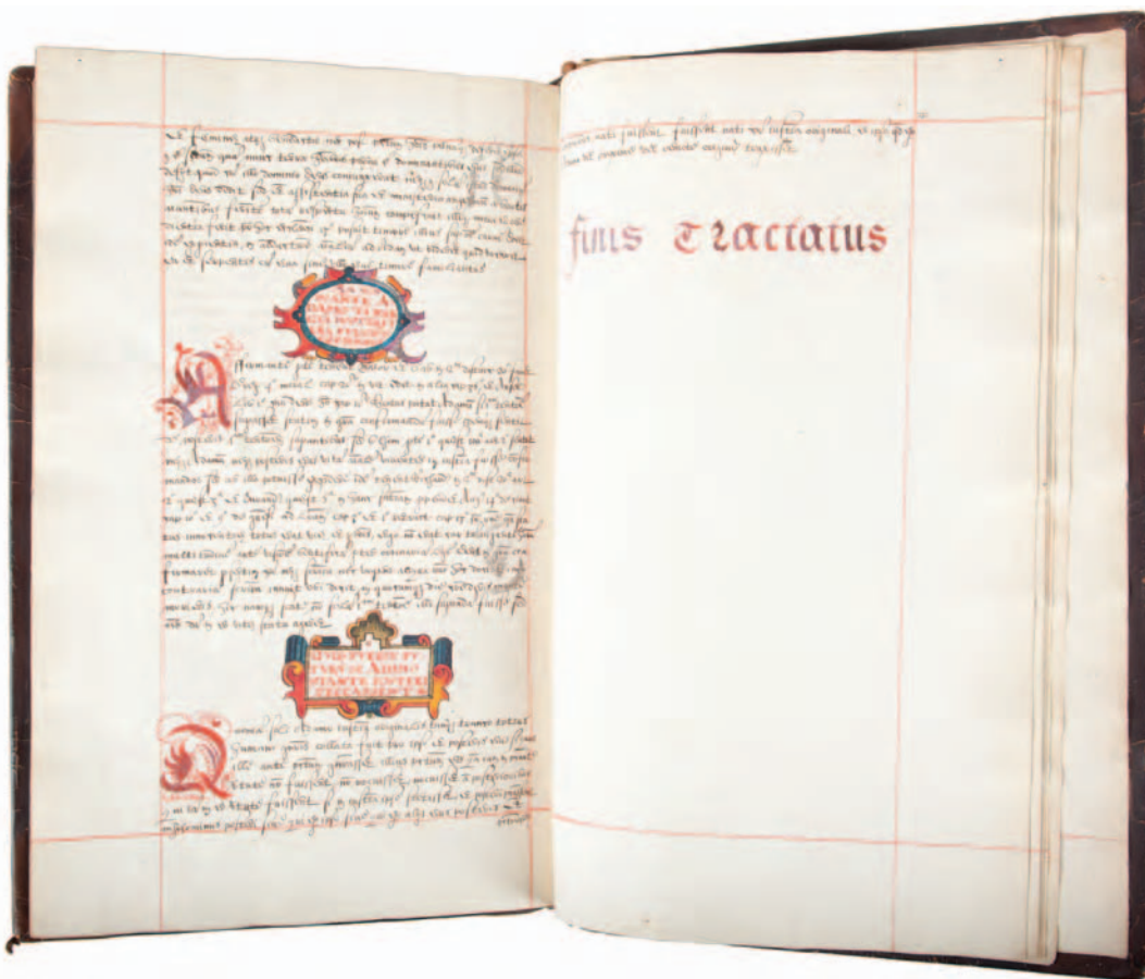
Reliures, filigranes des papiers, lettrines et cartouches témoignent d'un contexte culturel typique des copistes flamands de la fin du XVI e et du début du XVII e siècle.