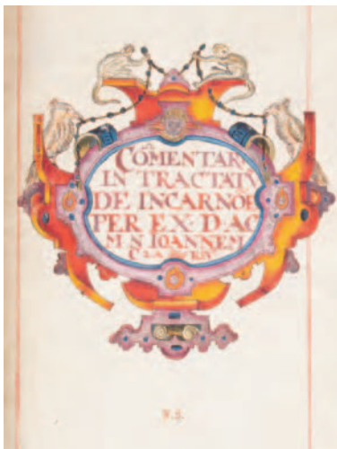
Certains cartouches sont symboliques. Le singe y renvoie à l'Homme, et l'oiseau, à l'Âme, notamment.