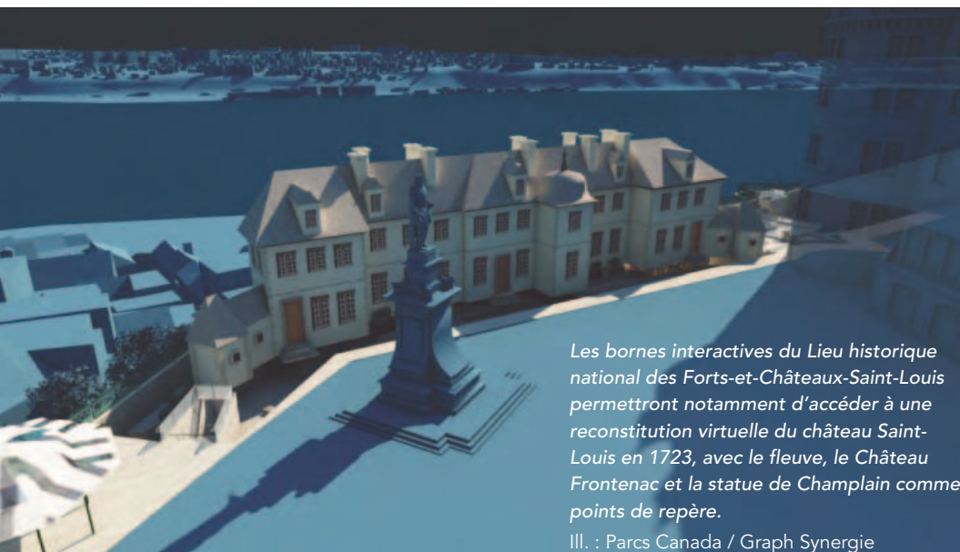
Les bornes interactives du Lieu historique national des Forts-et-Châteaux-Saint-Louis permettront notamment d'accéder à une reconstitution virtuelle du château Saint-Louis en 1723, avec le fleuve, le Château Frontenac et la statue de Champlain comme points de repère.

Si les nouvelles technologies contribuent à perpétuer l'intérêt pour le patrimoine en le faisant redécouvrir de façon ludique et originale, elles ont également une grande valeur scientifique, croit M. Lapointe. « L'information qui est présentée, analysée, captée et diffusée avec le 3D est plus précise, plus complète et plus détaillée. Cela permet par exemple de faire huit hypothèses de reconstitution d'un bâtiment, sans qu'on ait à refaire une maquette en bois chaque fois. Par la modélisation 3D, on peut estimer la température qu'il faisait en hiver dans une habitation au XVIII e siècle en fonction des pièces de matériaux retrouvées et de la hauteur estimée du plafond. »