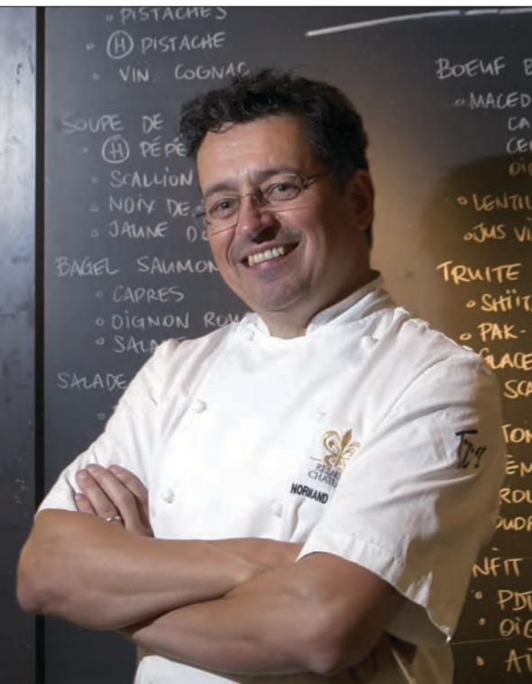
Pour le chef Normand Laprise, il est primordial de rester près des producteurs, de conjuguer les différents savoir-faire.