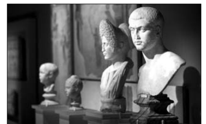
Bustes de Romains, Musée national romain, Palais Massimo aux Thermes

Dans le cadre des festivités officielles marquant le 150 e anniversaire de la réunification de l'Italie, le Musée de la civilisation présente, jusqu'au 29 janvier 2012, « Rome. De ses origines à la capitale d'Italie ». Cette exposition internationale explore en cinq temps l'histoire de la ville, cœur du christianisme et haut lieu des arts, de sa fondation en 753 av. J.-C. jusqu'au XIX e siècle, en passant par le Moyen Âge, la Renaissance et l'ère baroque. Elle compte près de 300 pièces, dont plusieurs n'ont jamais été présentées au public. Des mosaïques, fresques, bustes, bijoux, sculptures, tableaux et objets du quotidien qui se démarquent par leur beauté, leur histoire et leur force symbolique. Info : 418 643-2158 ou www.mcq.org