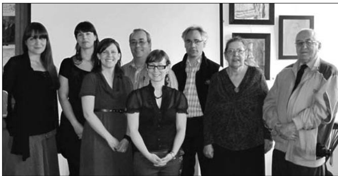
Les membres fondateurs du réseau muséal Lanaudière, ma muse