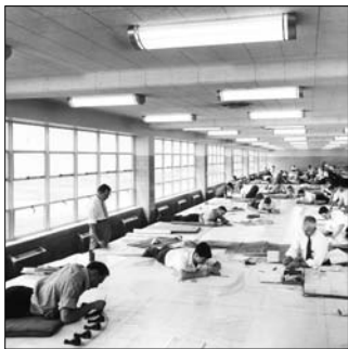
Usine de bombardiers de Ford Motor, Willow Run, Michigan, 1942.

Avec l'exposition itinérante internationale « Architecture en uniforme : projeter et construire pour la Seconde Guerre mondiale », de passage au Centre canadien d'architecture de Montréal jusqu'au 18 septembre, le commissaire Jean-Louis Cohen montre comment la guerre a accéléré les processus d'innovation et de technologie qui ont mené à la suprématie de l'architecture moderne. Cela, à travers l'étude de travaux et de réalisations d'architectes et de concepteurs, tout au long du conflit et sur toutes les lignes de front politiques. Info : 514 939-7026 ou www.cca.qc.ca