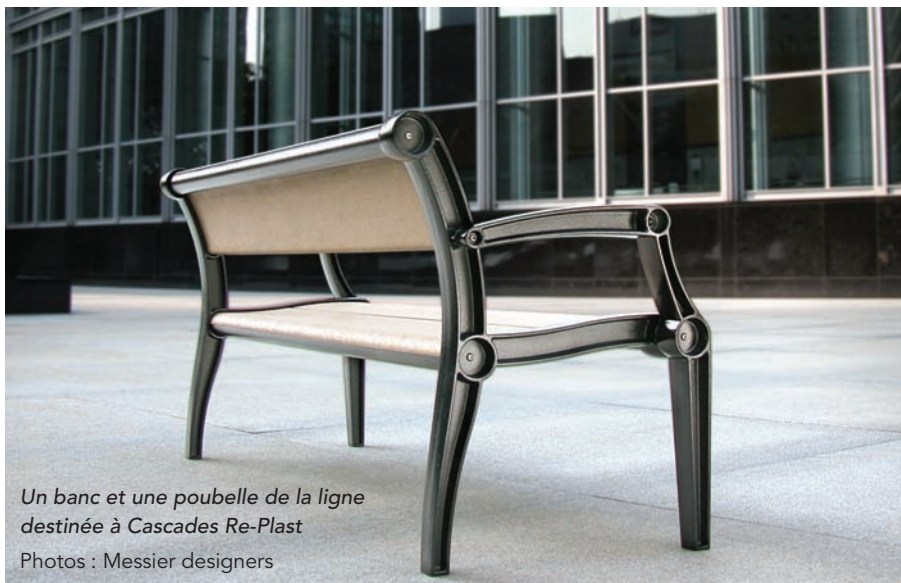
Un banc et une poubelle de la ligne destinée à Cascades Re-Plast