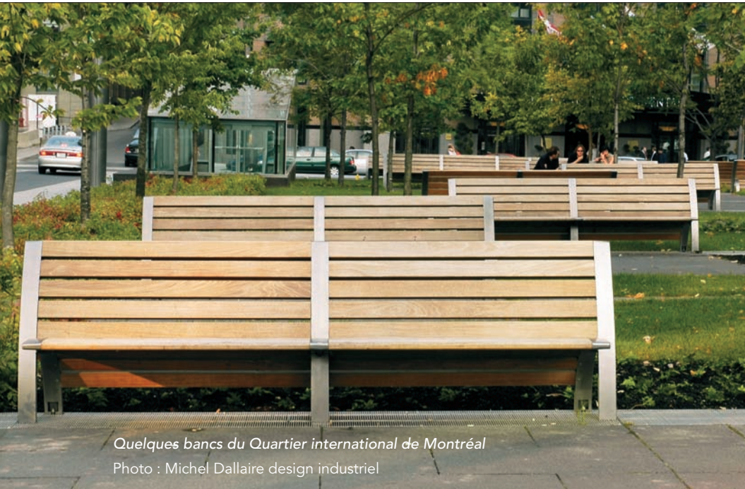
Quelques bancs du Quartier international de Montréal Photo : Michel Dallaire design industriel

Michel Dallaire, qui a notamment conçu le mobilier urbain du Quartier international de Montréal, le mobilier de la Grande Bibliothèque ainsi que le BIXI.