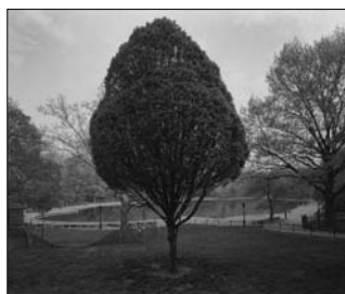
Bassin du jardin d'hiver, en direction nord, Central Park, New York, 1994, épreuve à la gélatine argentique, coll. Centre canadien d'architecture Photo : Geoffrey James

Jusqu'au 2 janvier, le Musée d'art de Joliette propose « Utopie/Dystopie », une rétrospective du photographe Geoffrey James, considéré comme l'un des plus éloquents interprètes du paysage au Canada. Organisée par le Musée des beaux-arts du Canada, l'exposition revisite trois décennies de travail artistique, au gré d'une centaine d'œuvres mettant en lumière l'intérêt de James pour le paysage et la diversité de ses investigations photographiques. De Paris à Tijuana, en passant par