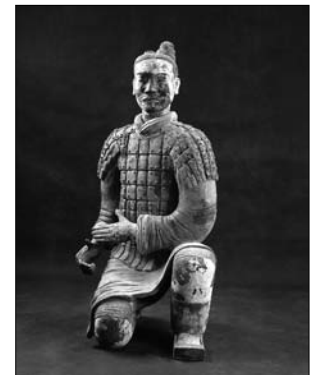
Arbalétrier, terre cuite et peinture, dynastie des Qin, 221-206 av. J.-C.

Du 11 février au 26 juin, le Musée des beaux-arts de Montréal recevra « L'empereur guerrier de Chine et son armée de terre cuite », un voyage à travers 1000 ans d'art et d'histoire de la Chine, de la dynastie Zhou (1045-221 av. J.-C.) à la dynastie des Han occidentaux (206 av. J.-C. à 23 ap. J.-C.). On pourra y admirer 300 objets, dont 14 des célèbres soldats en terre cuite grandeur nature de l'armée du premier empereur de la dynastie des Qin, la plus importante sélection jamais présentée en Amérique du Nord. On y verra aussi des récipients en bronze, des figurines en céramique, des ornements de jade, des épées en or, des accessoires militaires et bien d'autres trésors. Montréal. Info : 514 285-2000 ou www.mbam.qc.ca