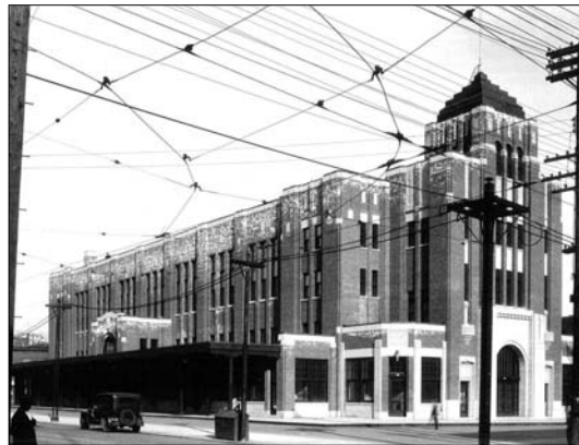
Le Marché Saint-Jacques en 1932 et en 2010

Situé au coin des rues Ontario et Amherst, le Marché Saint-Jacques a officiellement rouvert ses portes le 27 octobre, après des travaux de revitalisation de quatre millions de dollars financés par le promoteur immobilier Rosdev et la Ville de Montréal. Datant de 1871, le plus vieux des quatre grands marchés montréalais a ainsi retrouvé sa vocation d'origine : l'édifice Art déco qui l'abrite depuis 1931 accueille de nouveau une panoplie de boutiques d'alimentation. La rénovation de ce joyau historique de la métropole a été guidée par des préoccupations non seulement architecturales et patrimoniales, mais aussi environnementales ; le bâtiment est en voie d'obtenir la certification LEED du Conseil du bâtiment durable du Canada.