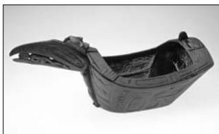
Bol haïda aux nombreux détails sculptés, 1800-1850