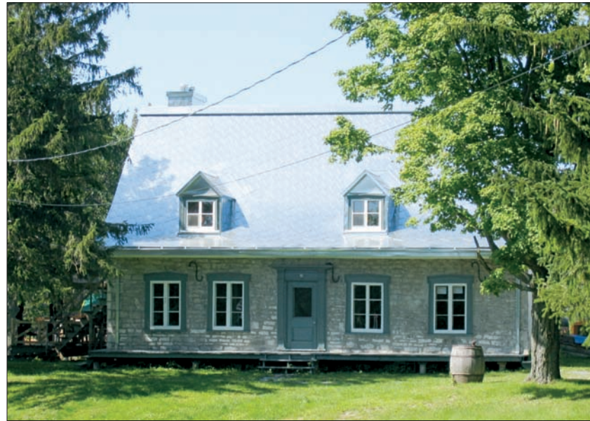
Construite avant 1786 et reconnue monument historique, la maison Quézel fait honneur aux premiers habitants du chemin du Roy.