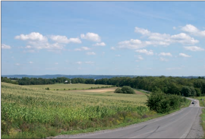
La Ville et les divers propriétaires déploient de nombreux efforts pour conserver les boisés.