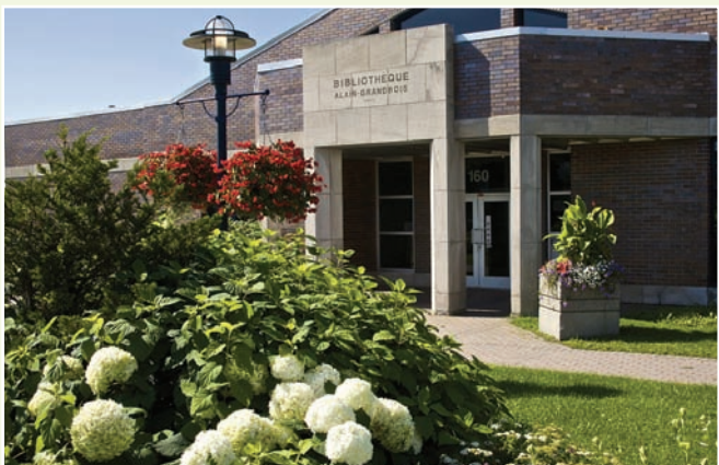
La bibliothèque Alain-Grandbois (160, rue Jean-Juneau)