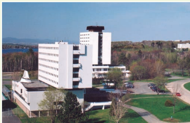
Quelques bâtiments des Campus intercommunautaires, patrimoine moderne de Saint-Augustin-de-Desmaures.