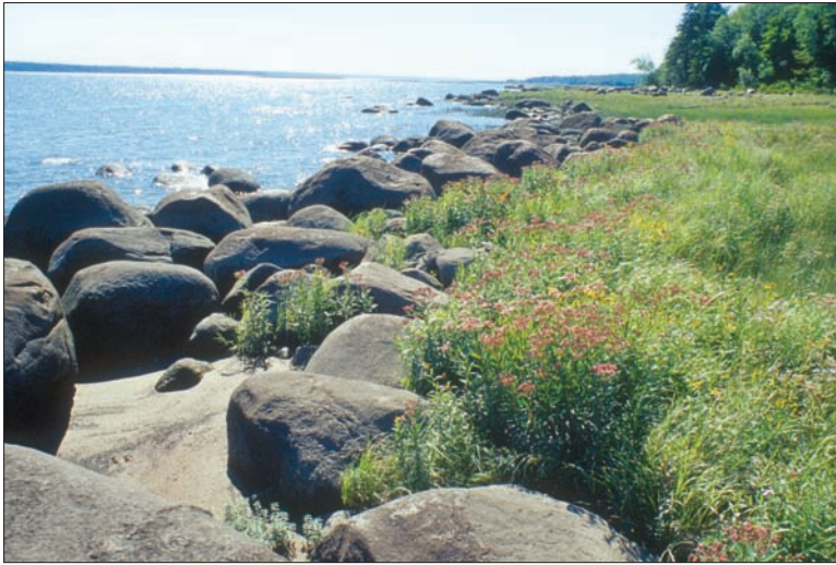
Les battures s'étendent sur environ 10 km. Une partie est en voie d'être reconnue comme aire de conservation pour la faune et la flore.