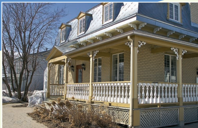
La Maison de la culture (341, route 138)

Carte conçue par Denys Légaré et Paull Labrecque, publiée en 2009, dépliant. En collaboration avec Marnie Augustin. Carte modifiée par Laframboise Design en 2010.