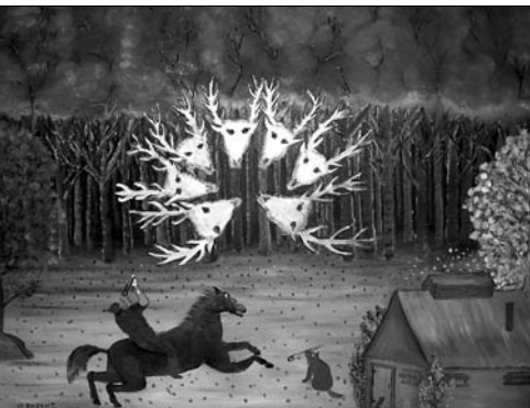
La bête à sept têtes, Jean-Claude Dupont, coll. Jean-Claude Dupont

même que des thèmes (nature, religion, etc.) et des personnages (diable et compagnie) qui reviennent d'une histoire à l'autre. Jusqu'au 16 mai, à Pointe-à-Callière, musée d'archéologie et d'histoire de Montréal. Info: 514 872-9150 ou www.pacmusee.qc.ca