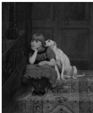
Briton Rivière, Sympathy , 1877, huile sur toile, coll. Royal Holloway, University of London

des ponts couverts au Québec depuis le début du XIX e siècle. En plus d'en apprendre davantage sur ces joyaux du patrimoine bâti, on peut se familiariser avec l'éclosion du réseau routier et l'aménagement du grand territoire québécois. Québec. Info: 418 643-8904 ou www.banq.qc.ca , onglet Centres d'archives