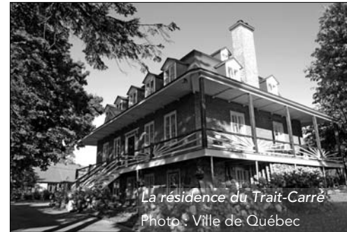
La résidence du Trait-Carré