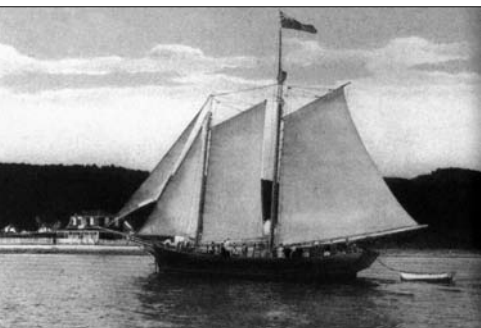
Photo : Valentine and Sons, 1900. Coll. de BAnQ, Centre d'archives de Québec

tions de toutes sortes, s'affirmait comme la grande voie de communication du Québec. Jusqu'au 2 mai, au Centre d'archives de Montréal. Info: 514 873-1100, option 4 ou www.banq.qc.ca , onglet Centres d'archives