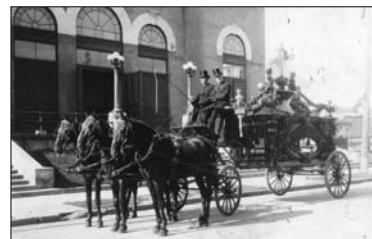
Corbillard hippomobile sur roues, années 1930.

Les pratiques funéraires au Québec des débuts de la colonie à nos jours, l'évolution des métiers qui y sont liés et les légendes qui y sont rattachées se trouvent au cœur de l'exposition « De vie à trépas », à l'affiche jusqu'au 11 mars 2012 au Musée québécois de culture populaire. Une panoplie d'artéfacts, tels qu'une table d'embaumement, un corbillard pour enfants, un habit traditionnel de croque-mort, un cercueil en béton et des bijoux faits à partir de cheveux pour honorer la mémoire du défunt, rendent compte des nombreuses transformations survenues dans le domaine. Trois-Rivières. Info: 819 372-0406 ou www.culturepop.qc.ca