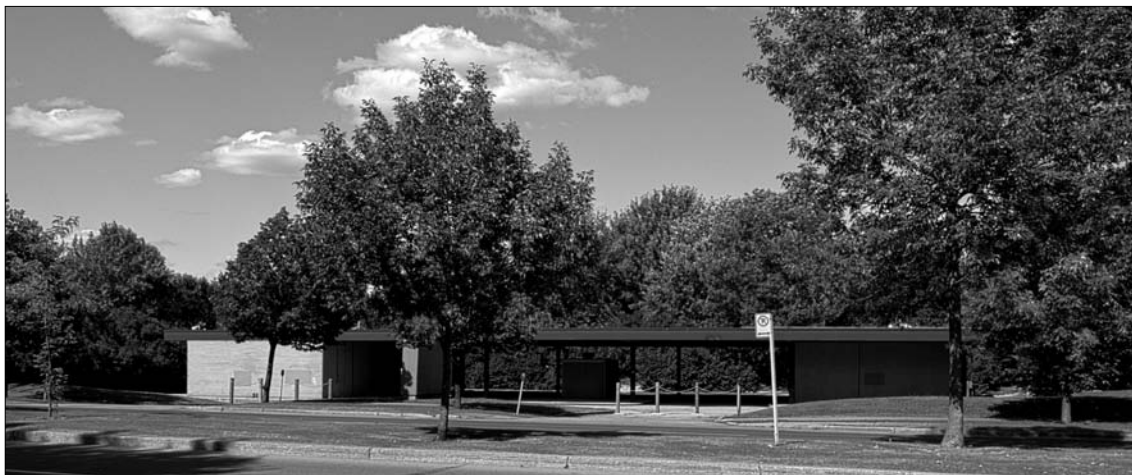
La station-service à l'été 2009