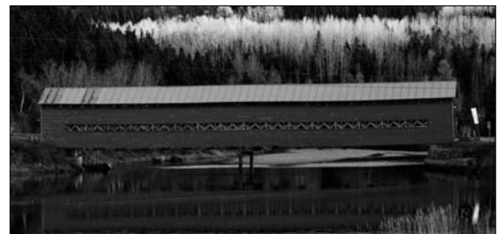
Le pont Galipeault à Grande-Vallée, en Gaspésie

Après 12 semaines à parcourir 15 000 km dans 14 régions pour prendre 6000 clichés, Manuel Mendo a mis en ligne son site sur les ponts couverts québécois. « Ponts couverts du Québec. Un autre regard » ( www.ponts.mendo-photo.com ) constitue une base photographique de tous les ponts couverts dits « authentiques » de la province et nous permet de les découvrir dans leur environnement. Ce site est également en lien avec le site et blogue « Les ponts couverts au Québec » de Pascal Conner ( www.pontscouverts.com ). Ainsi, lorsqu'on sélectionne un pont sur la carte interactive, on peut accéder tant à la galerie de photos de Mendo qu'à la fiche descriptive établie par Conner.