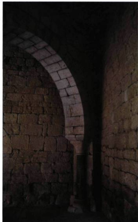
Arche du monastère de Santa Maria de Vilabertran, en Catalogne. L'ensemble monumental roman a été érigé entre le XI e et le XIV e siècle.