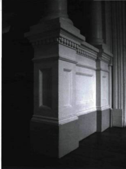
L'assise ornementale d'une colonne assure la préservation de sa base.