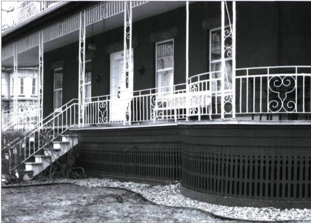
Des planches à la verticale découpées selon des motifs particuliers peuvent procurer un bel effet à la devanture de la résidence.

on pourra se fier aux dessins présentés dans cette page, qui illustrent la manière de concevoir et d'installer le treillis dans un cadre structural mouluré.