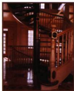
Escalier Mont Saint-Hilaire

La 7 e Journée de la Gaspésie a eu lieu le 29 mars dernier. Plus de 50 jeunes universitaires y ont manifesté leur intention d'aller s'établir en Gaspésie et aux Îles-de-la-Madeleine. Longue vie à l'utopie !