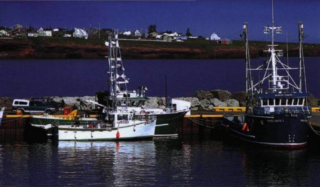
Au quai se côtoient les bateaux des pêcheurs et des plaisanciers.

consultations techniques. Les intervenants peuvent s'intéresser à un problème local – comme la relance de Murdochville –, prendre part à la mise en place de stratégies novatrices, donner des formations d'appoint ou participer aux travaux