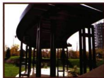
Pergola Îles des Sœurs Architecte Beaupré & associé

Téléphone : (418) 737-4331 R.B.Q. 8239-3703-30