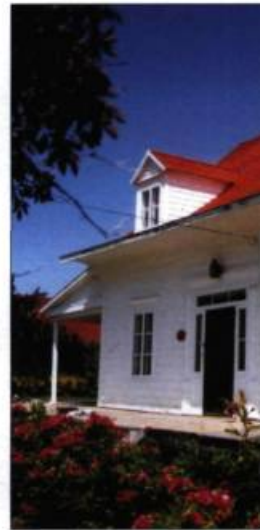
La coquette maison Garnier démarque par son contraste.

Ses paysages grandioses et contrastés, combinés à une population aux origines diverses, donnent à la Gaspésie un caractère unique qui se reflète dans la richesse de son patrimoine culturel. Jeter un regard sur cet héritage, c'est découvrir comment les Gaspésiens ont su développer une culture distinctive et leur propre manière de « bâtir maison ».