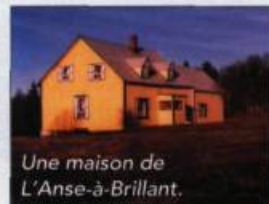
Une maison de L'Anse-à-Brillant.