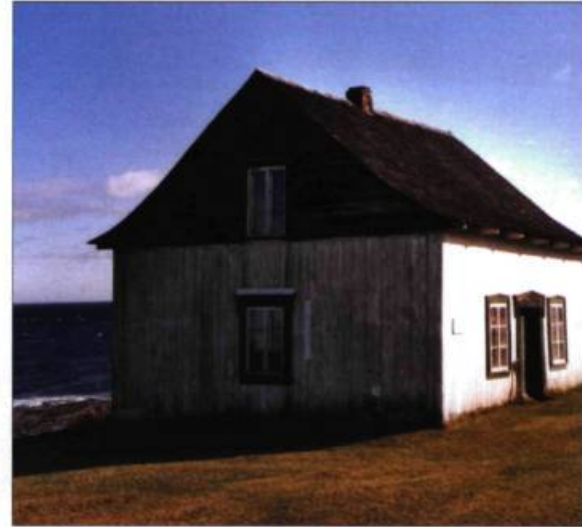
Maison de pêcheur de Ruisseau-à-Rebours. Ce modèle inspiré de la maison québécoise était fort répandu sur le pourtour nordique de la péninsule.

Les Acadiens, eux, influencent l'architecture domestique par la modestie des habitations, les techniques de construction et les matériaux utilisés. De petites demeures sont construites en bois équarri à la hache, en pièce sur pièce. Les Acadiens contribuent à répandre la technique de finition à queue d'aronde – d'influence américaine – de même que l'emploi du bardeau de cèdre sur les toits et les parements. Le modèle d'habitation le plus courant en Gaspésie, une maison dont l'avant-toit est percé d'un pignon central, est popularisé dans les provinces maritimes dans la seconde moitié du XIX e siècle.