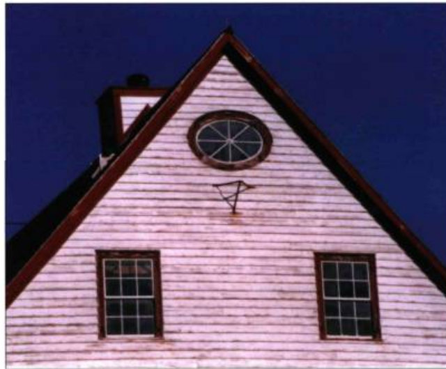
À l'île Bonaventure, l'œil-de-bœuf sur la façade du bâtiment Le Chafaud rappelle le souci du beau et de la finesse des constructeurs jersiais.