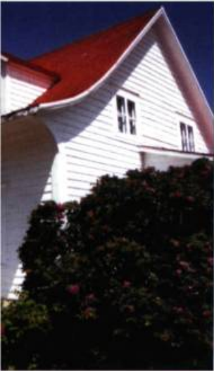
struite à Percé vers 1896, se cintre.