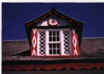
La lucarne à pignon ornée de motifs de la maison Le Boutillier.