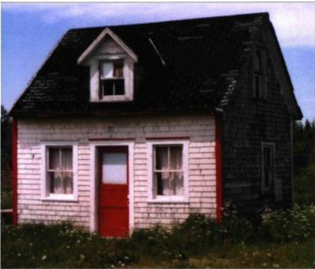
Modeste maison de colonisation à Bonaventure, typique des premières habitations gaspésiennes.