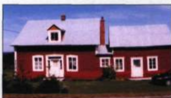
Une demeure de Ruisseau-à-Rebours.

Plusieurs ensembles patrimoniaux – bâtiments Robin à Percé, bâtiments du Banc-de-Paspébiac, site historique de Grande-Grave – rappellent que l'histoire gaspésienne est fortement liée aux activités maritimes et de pêche. Des magasins généraux et de compagnies de pêche