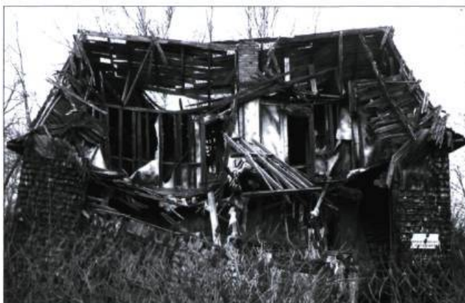
Œuvre intitulée Le temps d'un souvenir, est l'une des lauréates du concours.

Depuis 2001, le Conseil des monuments et sites du Québec organise « L'Expérience photographique du patrimoine », le volet québécois du concours international « L'Expérience photographique internationale des monuments », lancé par la Catalogne en 1996. Dans le cadre de ce concours, des élèves du secondaire sont invités à parcourir leur village, leur ville ou leur région à la recherche de sujets qui traduisent leur vision du patrimoine. Cette année, plus de 1700 jeunes ont participé au concours, grâce au soutien de 88 professionnels de 14 régions du Québec. Plus de 750 clichés ont été soumis au jury, représentant le regard personnel de jeunes de l'Abitibi à la Gaspésie, en passant par la Côte-Nord. Parmi ceux-ci, 10 ont été primés et 3 ont reçu une mention. Ces œuvres ont été dévoilées le 3 mai dernier au Musée populaire de la photographie à Drummondville. Elles feront partie de l'exposition internationale qui s'arrêtera au Musée de la Gaspésie, à Gaspé, du 8 octobre au 24 novembre. Pour voir les photos gagnantes, rendez-vous au www.cmsq.qc.ca/photos.htm