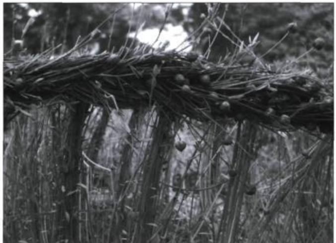
Tresse de lin

L a saison estivale se déroule sous le signe de la Biennale internationale du lin 2007 dans les lieux patrimoniaux de Portneuf. L'évènement en arts visuels « Le lin, chroniques et récits » regroupe les œuvres de 10 artistes contemporains dans l'église Saint-Joseph, dans le Vieux Presbytère et sur le cap Lauzon, à Deschambault. Le Moulin de La Chevrotière accueille « Lin sacré », une exposition présentant le travail de 13 créateurs associés aux métiers d'art. L'exposition « Mauvais plis », une histoire du fer à repasser, est proposée au Moulin Marcoux de Pont-Rouge. Les visiteurs pourront aussi apprivoiser le traitement de la fibre de lin selon les méthodes traditionnelles à la Caserne du lin de Saint-Léonard. La programmation complète de la Biennale ainsi que les heures et dates d'ouverture des différents lieux sont disponibles sur le site Web www.biennaledulin.ca ou à la Caserne du lin au 418 337-1498.