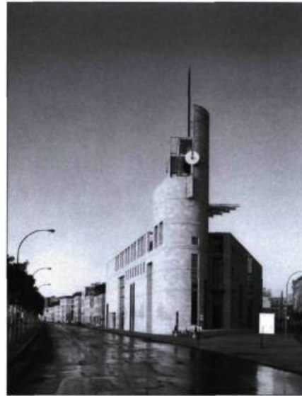
Les Rendez-vous des cultures se tiendront du 30 juin au 1 er juillet aux abords du musée Pointe-à-Callière, sur la place Royale.

Info : 514 872-9150 ou www.pacmusee.qc.ca