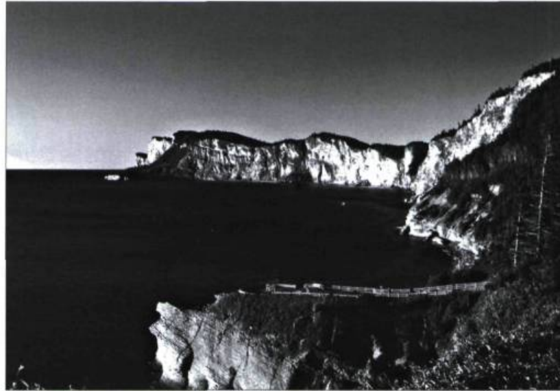
Le Parc national Forillon a été créé en 1970. Le paysage de la péninsule gaspésienne, qui s'étend sur 244 km 2 , se déploie du bord de mer aux formations rocheuses. Cet environnement est donc propice à accueillir plusieurs espèces animales et végétales arctiques-alpines, conférant au parc son caractère unique.

Dans ce contexte, il faut rappeler que l'intégrité et la poursuite de la mission des parcs nationaux canadiens exigent un financement adéquat, sans quoi ce patrimoine collectif est condamné à décliner.