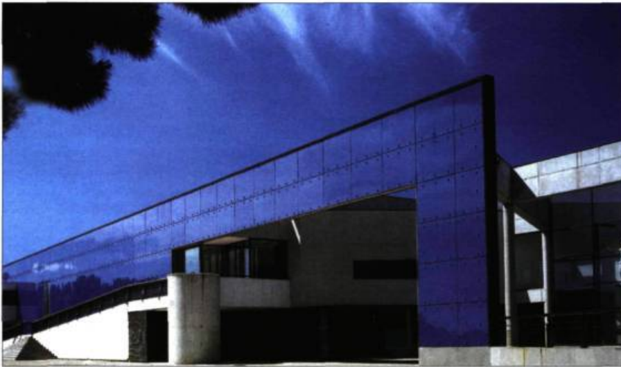
Inauguré en 1995, le Musée de l'Arles et de la Provence antiques a été dessiné par Henri Ciriani.