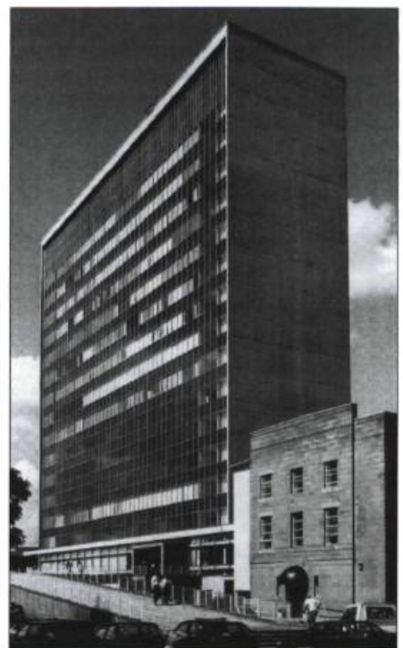
Le complexe Lanark County Buildings, à Hamilton en Écosse, a été conçu par l'architecte D. G. Bannerman entre 1958 et 1964.

Le choix des bâtiments et sites est d'abord basé sur des critères de sélection proches de ceux adoptés pour des œuvres plus anciennes, comme les valeurs d'unicité et