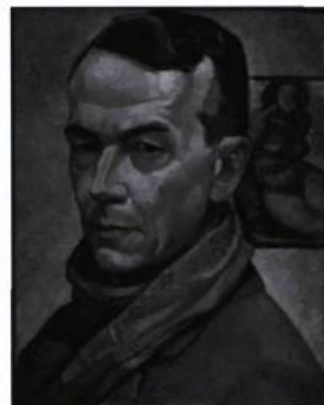
Autoportrait d'Edwin Holgate, huile sur panneau, 41 x 31,6 cm, 1934.

Du 26 mai au 23 octobre, le Musée des beaux-arts de Montréal présente l'exposition rétrospective « Edwin Holgate ». Cet artiste qui fut le huitième membre du Groupe des Sept est considéré comme une figure majeure de la communauté artistique montréalaise et de l'histoire de l'art canadien. L'exposition, une première depuis son décès en 1977, réunira 145 tableaux, dessins, aquarelles, estampes, illustrations de livres et photographies d'archives. Elle traitera de plusieurs aspects de sa production artistique : ses premières œuvres réalisées à Montréal, sa formation à Paris, les portraits de sa famille et de son cercle d'amis, les tableaux et gravures réalisés lors de son voyage en Colombie-Britannique et ses dessins et tableaux d'artiste militaire. Montréal. Information : (514) 285-1600 ou www.mbam.qc.ca