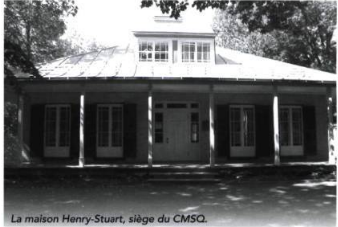
La maison Henry-Stuart, siège du CMSQ.

L'assemblée générale annuelle du CMSQ se déroulera dans la région de Québec la fin de semaine du 11 juin. Activités festives, visites et rencontres amicales sur le thème du patrimoine bâti et paysager de Québec et ses environs sont à l'ordre du jour. Information : (418) 647-4347, 1 800 494-4347 ou www.cmsq.qc.ca