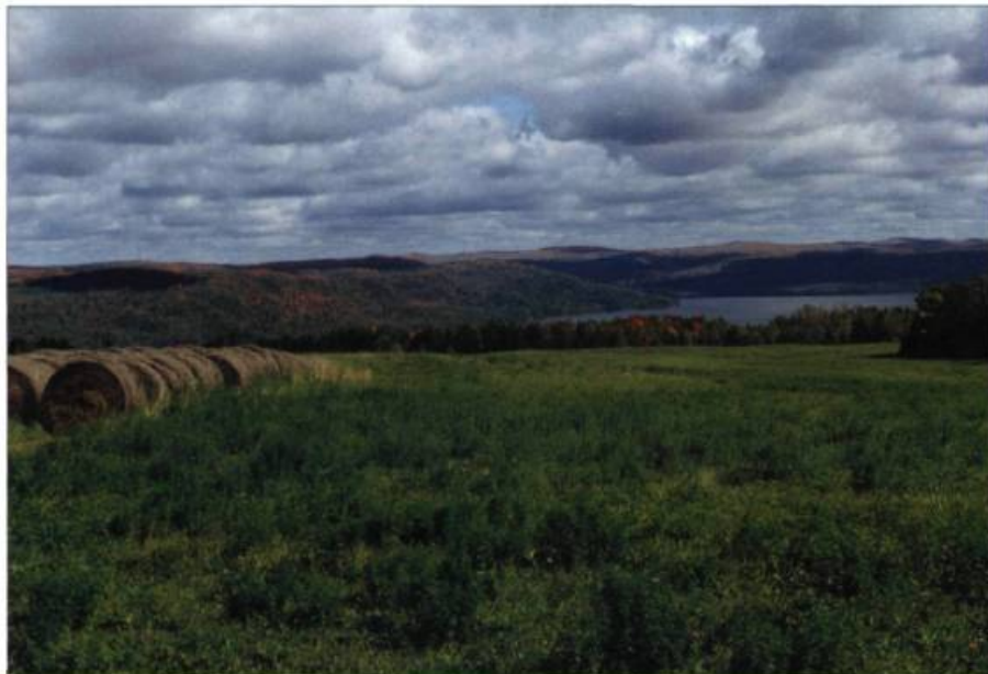
Le Témiscouata offre des vues apaisantes sur une nature souveraine.