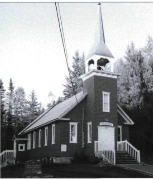
La chapelle évangéliste baptiste du Pied-du-Lac à Rivière-Bleue.