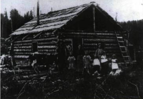
Cette maison des débuts de la colonisation a été construite en 1917 dans le 7 e Rang à Saint-Marc-du-Lac-Long.