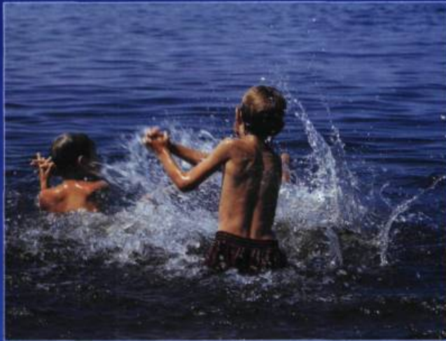
L'accès public aux berges du lac Saint-Jean demeure une préoccupation du milieu. Ici, les rives du lac à Roberval.