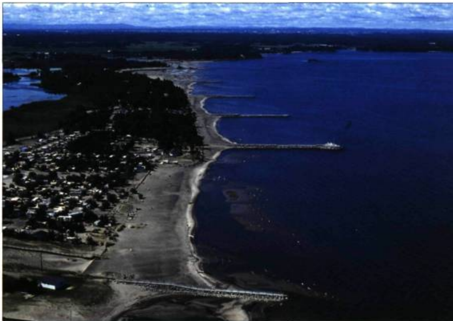
Un ensemble d'épis servant à protéger les berges à Saint-Gédéon.

(tions) et le Parc national de la Pointe-Taillon où se trouve la plus grande plage publique du lac Saint-Jean, la privatisation des rives, le développement de la villégiature et l'augmentation de la valeur marchande des propriétés en restreignent toujours l'accessibilité publique. Il s'agit