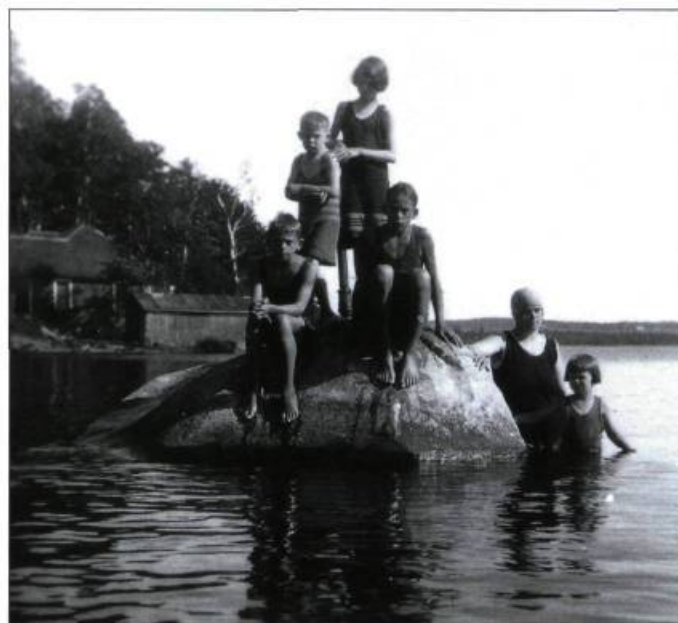
La baignade au lac Magog vers 1925.