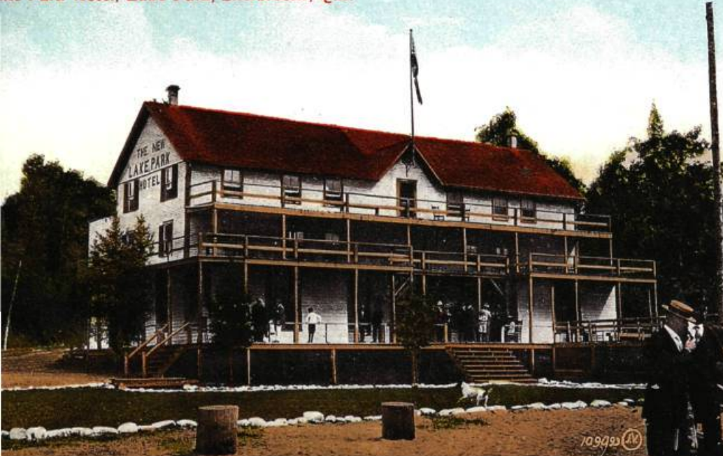
Lake Park Hotel, Lake Park, Sherbrooke, Que.

Le Vendôme ou Lake Park Hotel a ouvert ses portes en 1896 et est rapidement devenu le lieu de rendez-vous de la bourgeoisie de Sherbrooke.