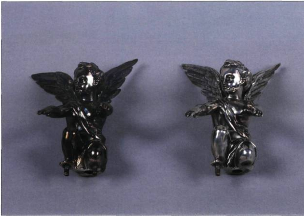
Angelots avant et après nettoyage.

Mais l'orfèvrerie n'est pas que rutilance, elle est aussi un art complexe et ses œuvres, des objets vulnérables.