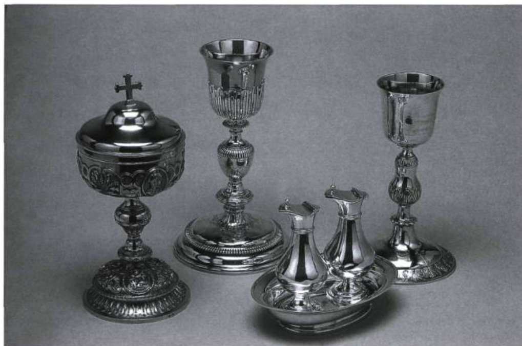
Diverses pièces d'orfèvrerie provenant de la collection du Musée de la civilisation.