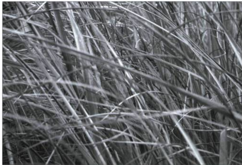
L'herbe à liens est connue dans la vallée du Saint-Laurent sous le nom de foin de grève. Elle occupe de vastes espaces sur le bord du fleuve.