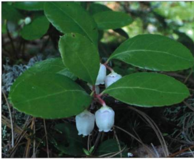
Le thé des bois a des vertus médicinales reconnues depuis des temps anciens.