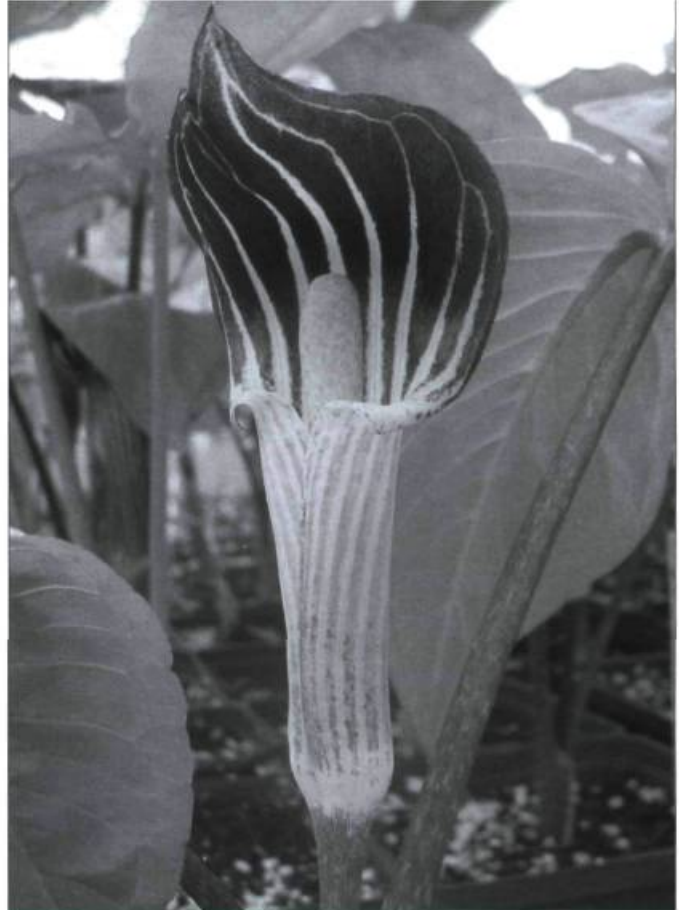
Le petit-prêcheur est une plante à floraison printanière. Les Amérindiens s'en servaient pour soigner les coliques.

■ Isabelle Dupras est architecte paysagiste.