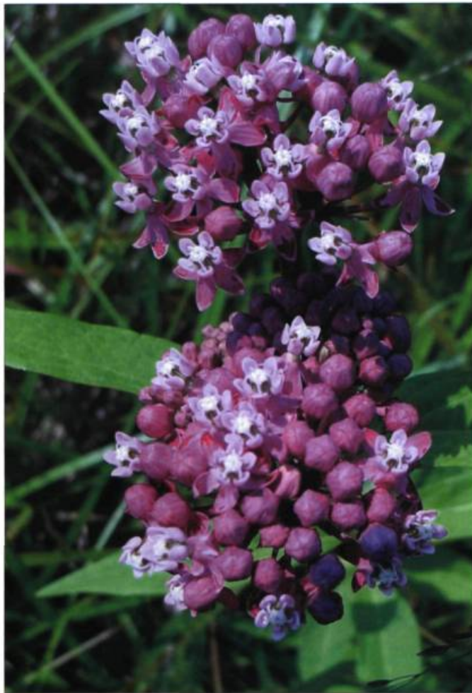
L'asclépiade commune est à l'origine de l'asclépiade Iceballet aujourd'hui disponible dans les centres jardins.

Petits-prêcheurs, amélanchiers, gingembres sauvages et verges d'or sont autant d'exemples de plantes utilisées au jardin. La culture et l'utilisation de ces espèces constituent une expérience ayant des résonances ethnobotaniques. En les côtoyant,