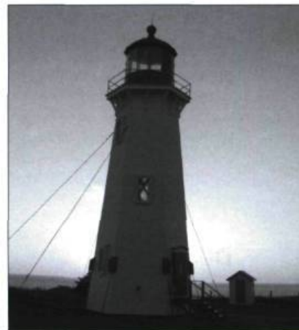
Le phare de Millerand à l'Anse-à-la-Cabane.