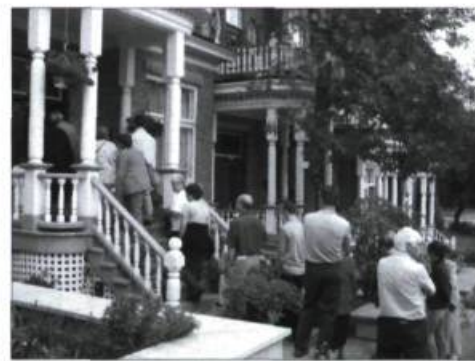
Visite d'intérieurs anciens à Beauport.

Information : (418) 647-4347, 1 800 494-4347 ou www.cmsq.qc.ca