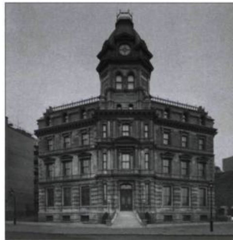
L'ancien édifice des Commissaires du Port de Montréal restauré.