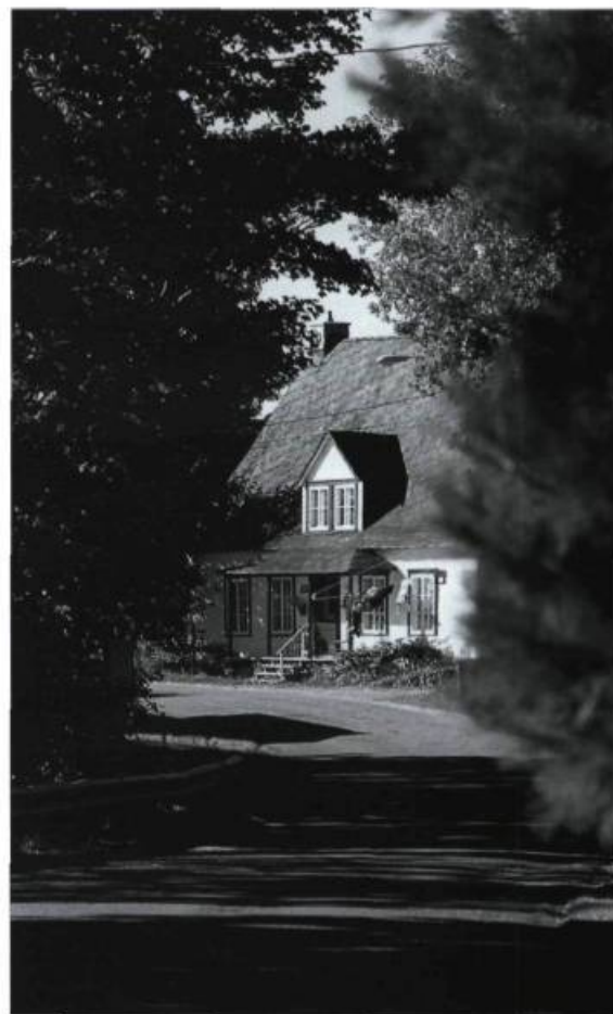
Au cœur du village de Neuville, des maisons tricentennaires rappellent que l'occupation du territoire de Portneuf date des premiers temps du pays.