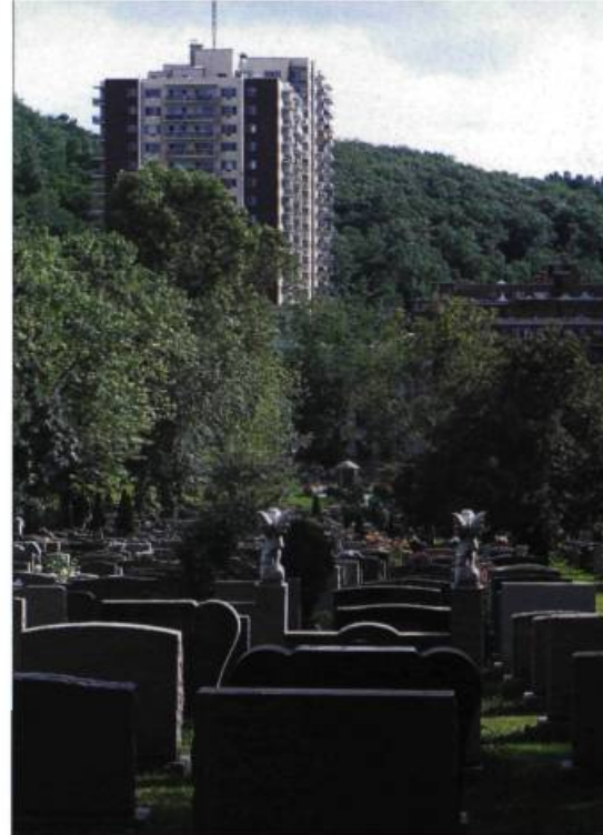
Le développement du cimetière Notre-Dame-des-Neiges inquiète les organismes de protection du mont Royal.

La firme d'architectes Beaupré & Michaud, mandatée pour étudier les possibilités du site, a proposé cinq hypothèses: vendre une partie du site à la Ville pour en faire un parc, vendre L'Ermitage (un immeuble du site), louer une partie des autres édifices, creuser un stationnement souterrain ou construire des immeubles résidentiels