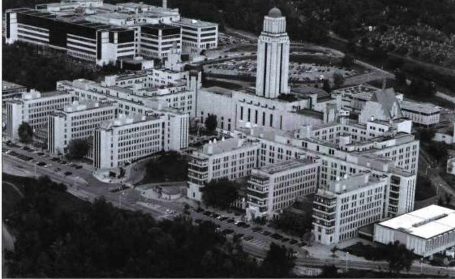
L'Université de Montréal occupe un large pan de la montagne comme le montre cette vue aérienne du flanc nord-ouest.