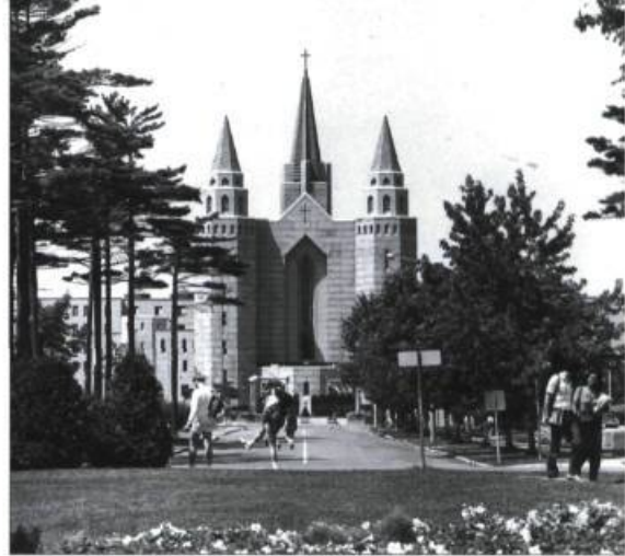
Le pavillon Casault de l'Université Laval, autrefois séminaire pour la formation des prêtres, aujourd'hui pavillon universitaire et centre des Archives nationales du Québec.

Par ailleurs, si des églises et des résidences de religieux ferment, les diocèses, eux, ne sont pas près de fermer. Comme le droit canon de l'Église catholique invite les évêques à se préoccuper de toute question