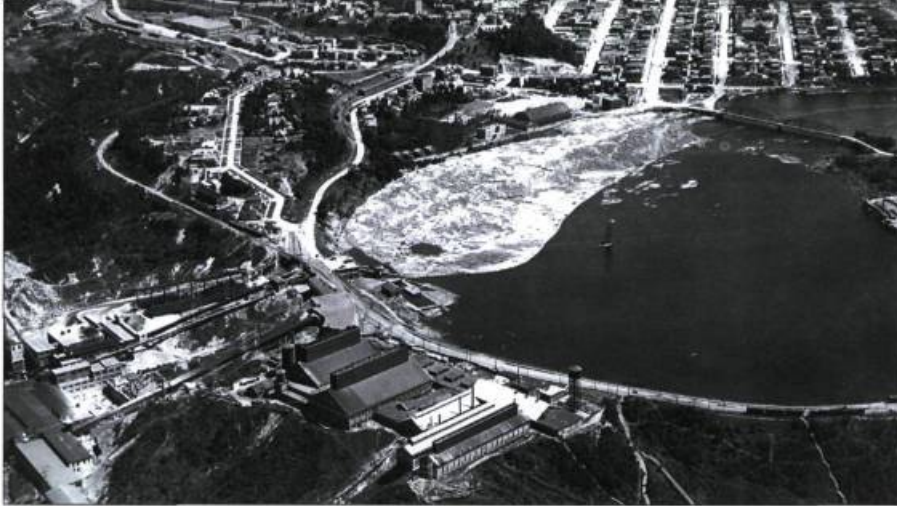
Vue aérienne de 1918 du bastion industriel formé par la Northern Aluminium Co. et la Belgo. Jeune d'à peine 20 ans, le quartier de la Pointe-à-Bernard s'avance au creux d'un méandre de la rivière Saint-Maurice.

L'électricité agissant comme moteur de développement de plusieurs industries chimiques, Shawinigan s'affirme de plus en plus comme le centre industriel chimique au Québec. En 1927, la Shawinigan Chemicals Ltd regroupe les entreprises œuvrant dans ce domaine. Cette fusion donne naissance à l'un des plus grands complexes au monde d'usines chimiques sous une même bannière.