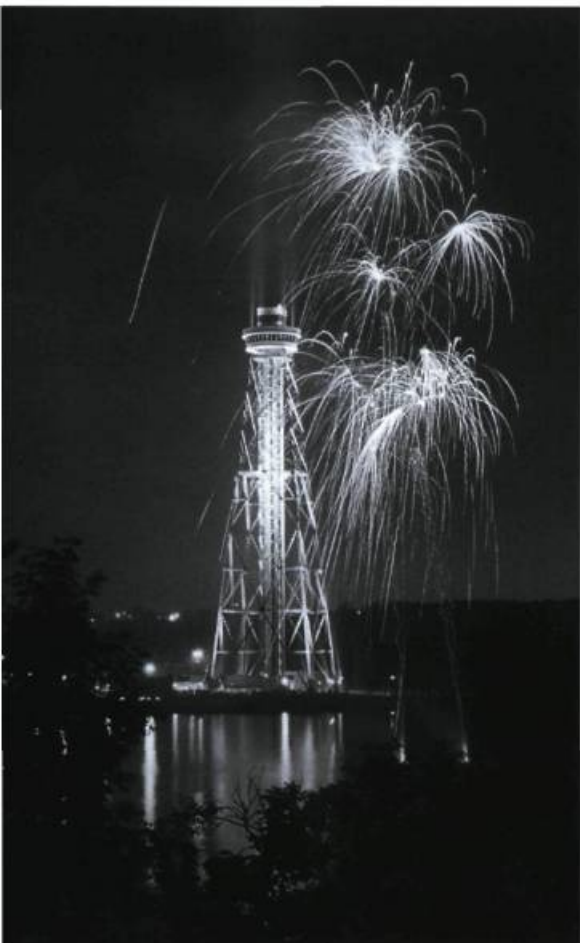
La tour de la Cité de l'énergie.

Lancé au début des années 1980, le projet de la Cité de l'énergie se concrétise en 1997 avec l'ouverture au public d'une installation touristique spectaculaire. La réalisation de ce projet grandiose se fonde