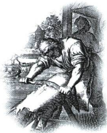
Au XIX e siècle, un ruisseau et un métier, tous les deux disparus aujourd'hui, animent le quotidien du Village des tanneurs.

Dès 1805, c'est depuis un étang situé au village de la Côte-des-Neiges qu'on approvisionne les 63 premiers abonnés (qui ne sont pas autorisés à revendre l'eau). Cette eau est amenée par gravité, dans des tuyaux de bois, vers deux réservoirs situés à l'angle des rues Berri et Notre-Dame et à l'angle de la rue Guy et du boulevard Dorchester (René-Lévesque). Bien vite, il apparaît plus efficace de pomper l'eau du fleuve.