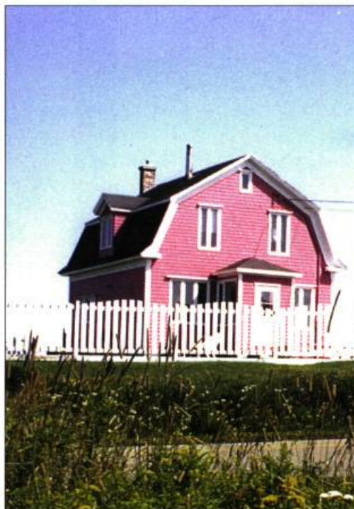
Une des maisons très colorées aux Îles-de-la-Madeleine.

la couleur d'un mur, on ajoutera des touches de sa complémentaire pour réaliser une harmonie de couleurs agréable à l'œil.