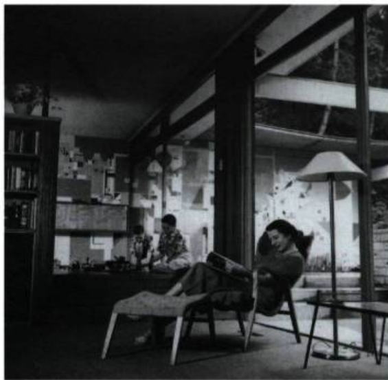
Graham Warrington, photographe; D.C. Simpson, architecte. Salle de séjour de la maison D.C. Simpson, West Vancouver, 1954. Avec la permission de Barry Simpson et Gregg Simpson. © 1997 Graham Warrington