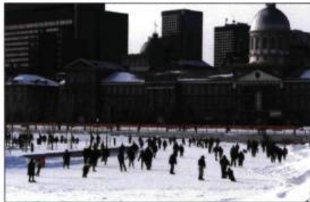
La patinoire du Vieux-Port