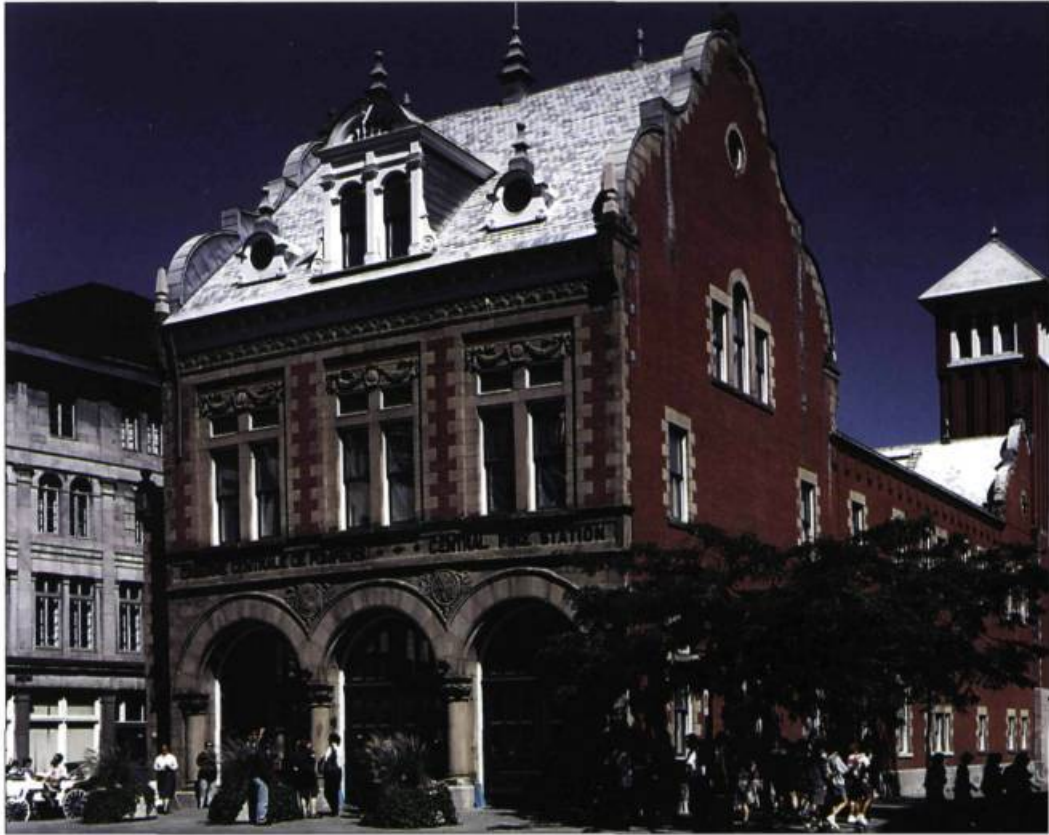
Le Centre d'histoire de Montréal, place d'Youville, loge dans l'ancienne caserne de pompiers construite en 1903.

En 1862, au moment où des membres de la bonne société fondent la Société d'archéologie et de numismatique de Montréal (SANM), le quartier historique vient d'amorcer une mutation profonde. L'Hôtel-Dieu a quitté son complexe conventuel, l'Hôpital général est sur le point de l'imiter et la bourgeoisie migre vers les pentes de la montagne. Réalisant le potentiel historique du patrimoine montréalais, dont une partie disparaît sous ses yeux, le SANM s'engage bientôt dans la mise en valeur et même la défense de l'histoire montréalaise, façon XIX e siècle. Jusque dans les années 1940, elle sera la seule, avec la Société historique de Montréal (1858) et quelques historiens et archivistes à y porter une attention aussi active.