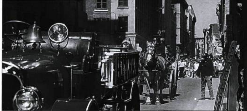
Défilé de voitures anciennes lors de la Fête de l'histoire, édition 1996. Cette fête a été organisée par les commerçants de la rue Saint-Paul en collaboration avec les musées et le Bureau de promotion du Vieux-Montréal.