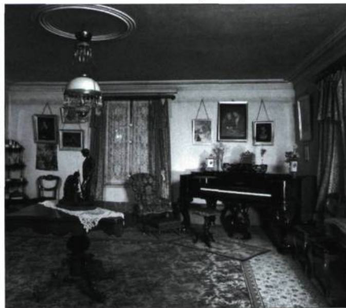
La maison a conservé ses couleurs et papiers peints d'origine et tous ses accessoires de la vie quotidienne.