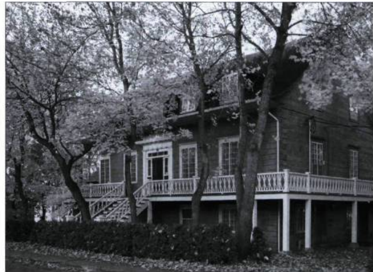
La maison Louis-Bertrand traduit la prestance de son bâtisseur.

de planches cloutées, abrite à l'origine la fonction commerciale — magasin général, entrepôt et bureau de poste, cabinet public — et les cuisines de la maison. Le premier étage, grandement éclairé et hautement dégagé du sol, compose l'étage « noble » : de chaque côté d'un vestibule intérieur prennent place le grand salon, dans toute son opulence victorienne — les plafonds font 3,5 mètres —, et une généreuse salle à manger, plus tard recyclée en vivoir. Au même niveau, à l'arrière, côté nord, on retrouve quatre chambres, dont celle plus vaste des maîtres, avec système de cloche relié aux cuisines pour l'appel des domestiques et celle dite « du salon » réservée aux visiteurs. Au troisième niveau, dans l'espace