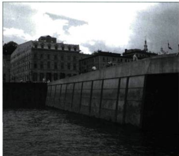
Vieux-Port de Québec : un quai n'est pas nécessairement synonyme d'accès et d'usage de l'eau.

À l'aube de l'an 2000, rades et bassins fluviaux trouveront leur rentabilité en offrant une polyvalence