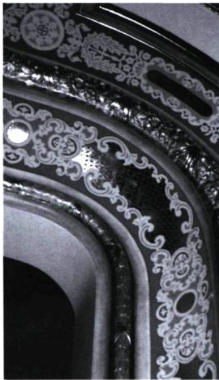
Détails architecturaux qui montrent la finesse de la restauration du Capitol de Moncton.

On invite David et Peggy Hannivan, deux spécialistes de la restauration de théâtres anciens à Toronto, à visiter le théâtre. Se fiant à quelques vieilles photos en noir et blanc, ils découvrent la riche décoration originale, dont la murale au-dessus de l'avant-scène et les multiples motifs au pochoir créés par Emmanuel Britta, l'un des plus grands décorateurs de théâtre de l'époque. Pour réduire les frais de restauration, on engage des artistes locaux qui travaillent sous la direction d'un contremaître de l'équipe Hannivan.