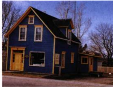
Cette maison traditionnelle à toit à deux versants est percée d'une lucarne et peinte de couleurs contrastantes.

En Acadie, la maison traditionnelle dite « à un étage et demi » était simple et compacte : presque carrée, fenêtres et ouvertures encadrées, deux