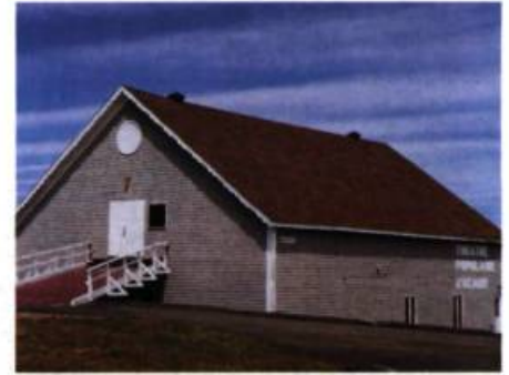
Ancien hangar de pêche construit en bardeaux, la Boîte-théâtre date du siècle dernier.

On rencontre fréquemment un modèle plus petit et symétrique dont le toit est également en pente prononcée. Les lucarnes et la finition sont généralement soignées.