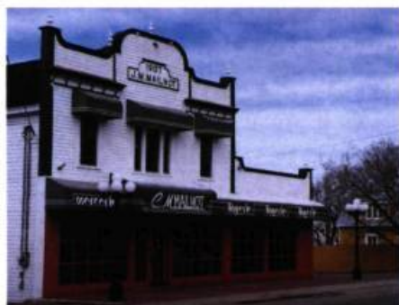
Le magasin Mailhot, une construction de type boomtown.