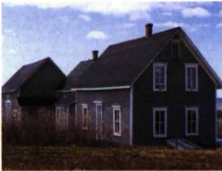
La maison Léopold Foulem présente un ensemble original de constructions alignées.

Tout près du Vieux Couvent, l'église Saint-Pierre-aux-Liens, commencée en 1856 et terminée en 1864, est d'un genre bien particulier. Construite