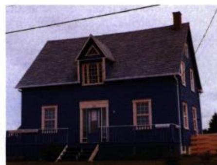
Les galeries sont de différents styles : avec balustrade ou mur à mi-hauteur en guise de balustrade.

En 1915, le collège du Sacré-Cœur de Caraquet avait 16 ans. Dans la nuit du 31 décembre, il a brûlé. Mais son souvenir est toujours présent. Les pierres du collège ont servi à la construction de plusieurs maisons.