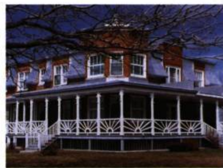
Maison à toit brisé agrémentée de tourelles.