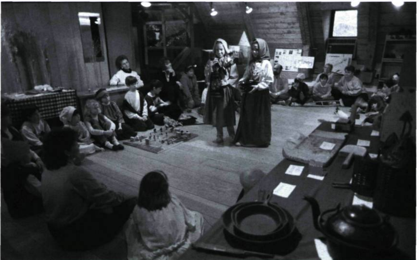
La présentation des personnages et des objets choisis à l'ensemble du groupe.