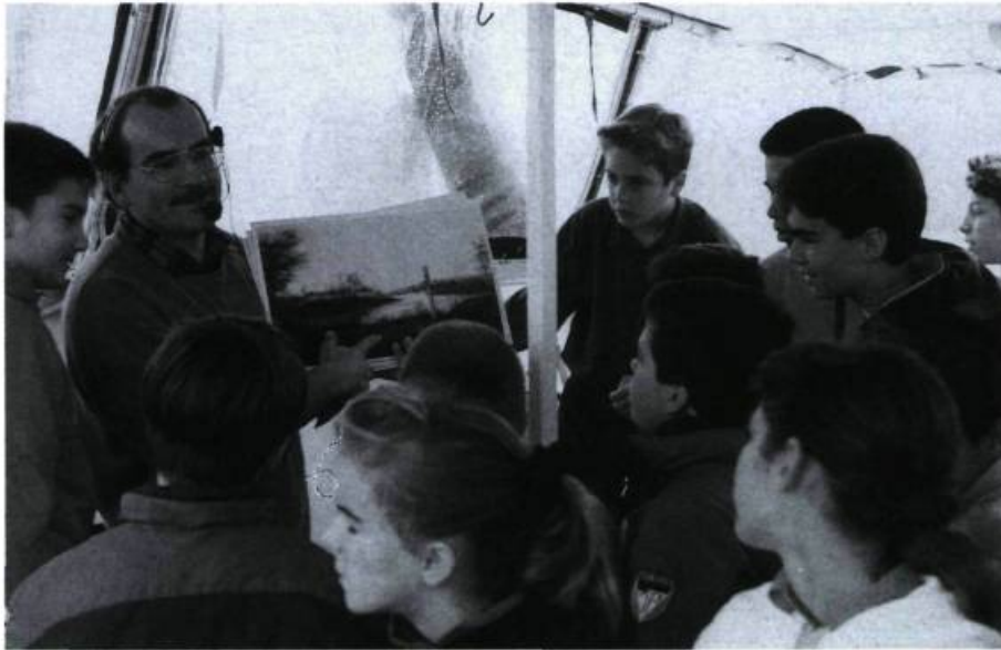
Exploration du Saint-Laurent.

«nouveaux usages du bois», la «flore estuarienne du Saint-Laurent» et le «sens social chez les animaux» viennent alimenter le goût de la science et de la nature.