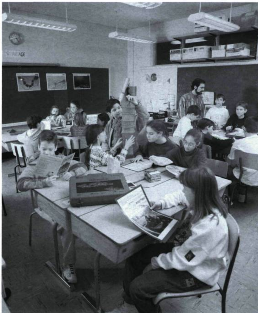
Trousses éducatives sur les énigmes du Saint-Laurent.

Lors de sa création, en 1929, la Linnéenne est une société savante ayant son berceau à l'Université Laval; à l'image de ses homologues européens de Provence, de Bordeaux, de Londres et de Stockholm, elle se destine à la communication scientifique et c'est par Le Naturaliste canadien que ses membres diffusent leurs différentes recherches menées en sciences naturelles. Plus tard, plusieurs de ses membres mènent des expéditions et rapportent du matériel visuel inédit. Une série de conférences sont présentées à l'Institut canadien, au collège des Jésuites, à l'Université Laval et à l'Aquarium du Québec; elles reflètent l'enthousiasme et l'intérêt des membres pour la biologie, l'écologie, la zoologie, l'entomologie et la botanique, sans oublier la minéralogie et la géologie. Comme les chercheurs travaillent sans bénéficier d'aucun appui, les naturalistes passionnés et les étudiants en sciences trouvent au sein de la Société linnéenne du Québec le soutien nécessaire à l'avancement de leurs études ou de leurs passions. Par la même occasion, ils contribuent à transmettre le goût des sciences naturelles dans leur milieu et auprès de la jeunesse québécoise.