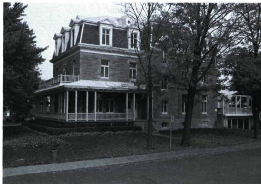
Presbytère Sainte-Famille.