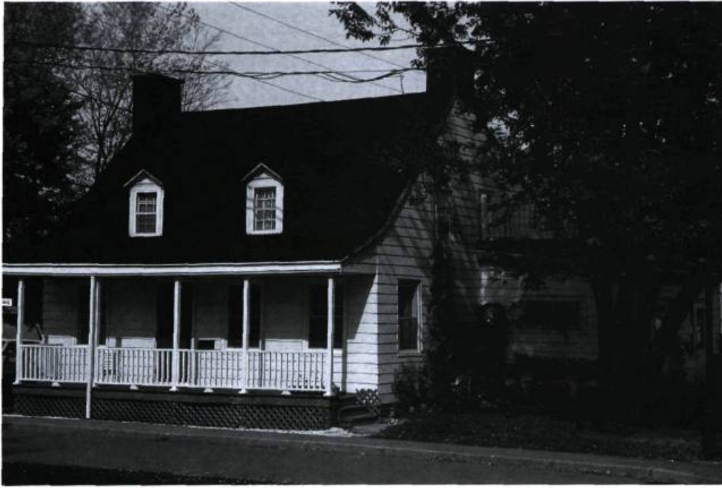
Maison Charles-Guimond.

d'art de grande valeur. Ce temple fut classé monument historique en 1964 et restauré en 1969 sous la supervision du curé de la paroisse, feu Mgr Poissant. Le remarquable travail de restauration fut réalisé par l'architecte Claude Beaulieu. Une monographie de l'église Sainte-Famille, rééditée en 1991, décrit toutes les richesses de ce joyau du patrimoine bouchervillois.