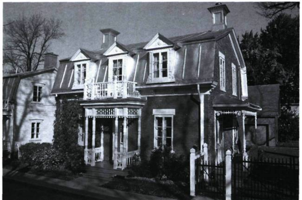
Maison Faubert-Aubertin.

La maison Guimond, qui date de 1835, est située au coin du boulevard Marie-Victorin et de la rue De la Perrière. L'intérieur est dans un état de conservation remarquable. Quant aux pièces de serrurerie, elles ont été fabriquées par le propriétaire-forgeron. Les lucarnes ont par ailleurs conservé leurs fenêtres à petits carreaux et les cheminées sont en chicane. Elle est une des rares habitations préservées de l'incendie de 1843.