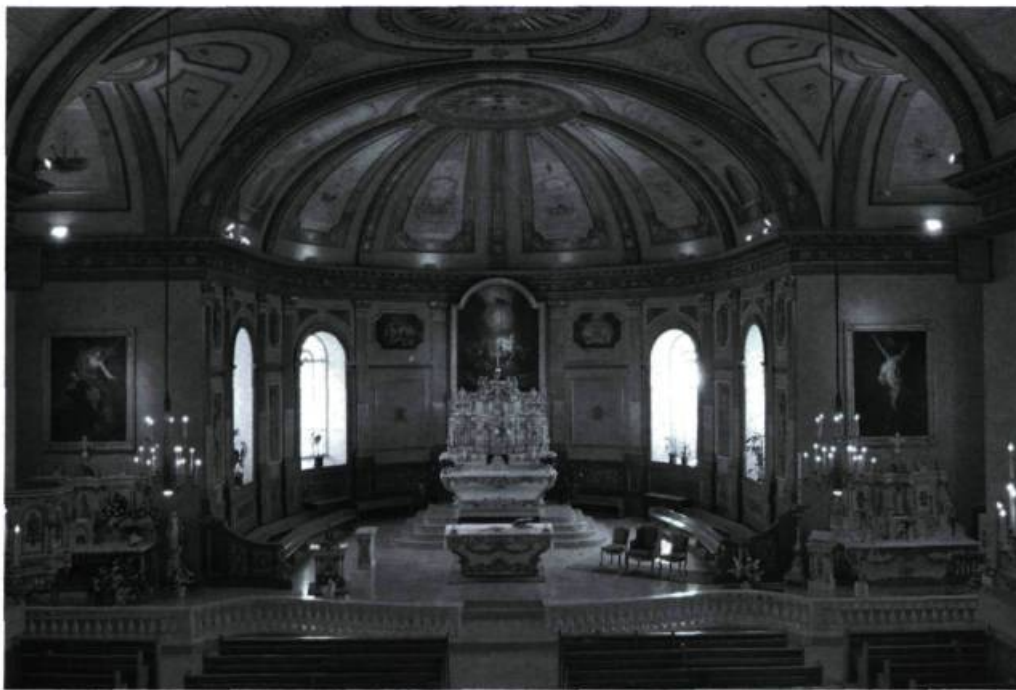
Vue intérieure de l'église.

La sécurité des colons préoccupe le seigneur de Boucherville. En effet, à l'intérieur du bourg, le fort protège les habitants. On y retrouve le château seigneurial, la chapelle et des maisons de colons. Les terres sont pour leur part distribuées de proche en proche de chaque côté du bourg.