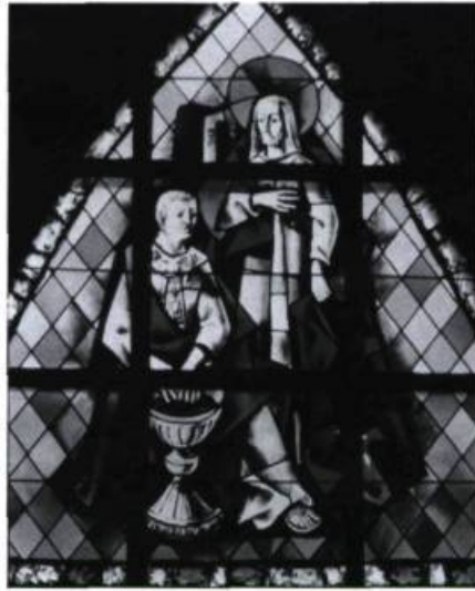
Le Christ devant Ponce Pilate, par Max Ingrand (c. 1960), à l'église Saint-Edmond de Lac-au-Saumon. (photo: Michelle Chabrost)

Église Saint-Sauveur, rue Victoria (Beaulieu & Rochon, 1897-1899.)