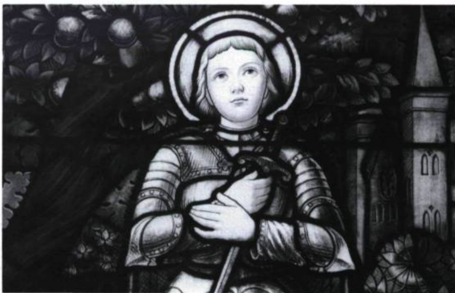
Au baptistère de l'église Saint-Roch de Québec (c. 1920), une sainte Jeanne d'Arc, réalisée par Hofvengrin pour le manufacturier montréalais Hobbs.