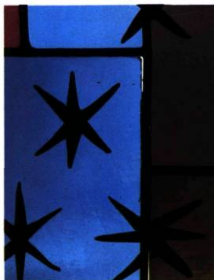
Le jour entre les plombs et les verres est la conséquence d'un mauvais travail d'assemblage.