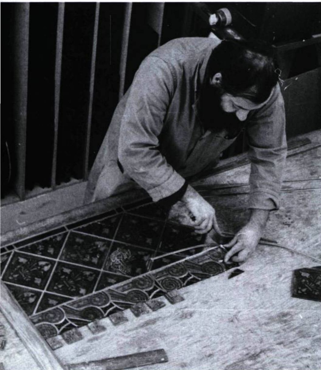
Le sertissage.

La reconstruction complète d'un vitrail est une entreprise majeure. Dans le cas de vitraux aux motifs géométriques simples et sans grande valeur patrimoniale, il peut s'avérer moins onéreux d'en faire une copie que de les restaurer, bien que cette dernière solution ait l'avantage d'en préserver l'authenticité. Un atelier pourra reproduire la plupart des pièces, y compris celles qui sont ornées de motifs peints, quoiqu'il ne soit guère possible d'obtenir le même type de verre.