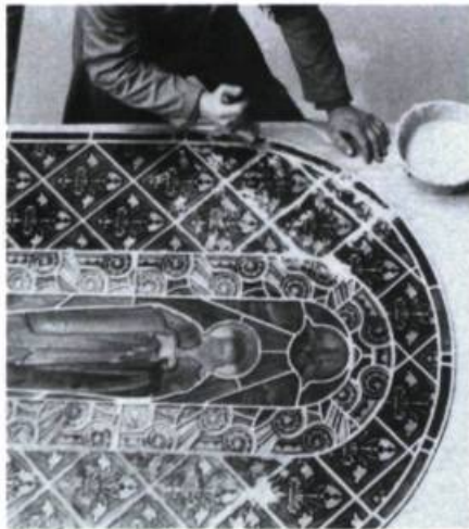
Le masticage.