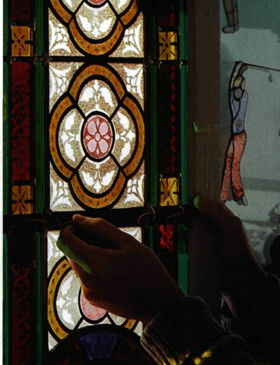
Les vergettes sont reliées aux plombs à l'aide de fils de cuivre et ancrées au cadre de la fenêtre.

Les morceaux de verre aux formes singulières sont maintenus ensemble au moyen de languettes de plomb profilées en forme d'H (les plombs), soudées les unes aux autres. On comble le mince intervalle entre le verre et les plombs à l'aide d'un mastic. Ce dernier maintient le verre en place tout en le rendant étanche et, surtout, il donne à la fenêtre sa solidité. Le plomb, en effet, n'a pas de propriété portante et, employé seul, il aurait tendance à fléchir sous le poids de la fenêtre. Les vitraux de grandes dimensions sont de plus renforcés par des tiges métalliques (vergettes) posées à environ tous les cinquante centimètres sur la face intérieure des panneaux. Les vergettes sont fixées au cadre de la fenêtre et reliées au vitrail par des anneaux de plomb ou de cuivre soudés aux plombs. Il arrive parfois qu'on superpose plusieurs panneaux, chacun reposant sur une traverse de fer en T ancrée au cadre.