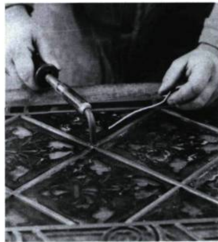
La soudure.

Habituellement, un vitrail est bombé parce que le mastic a cédé ou que les plombs se sont détériorés. On doit alors le retirer de son cadre et le déposer à plat. Si les plombs sont en bon état, les verres seront redressés puis consolidés à l'aide de mastic. Les languettes de plomb très distendues seront remplacées par des pièces de même profil et de mêmes dimensions. Toutefois, lorsque le métal est corrodé, l'armature de plomb doit être entièrement refaite par des experts, dans un atelier bien aéré (l'intoxication par le plomb constitue un risque sérieux).