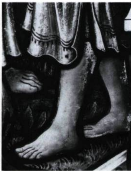
Exemple d'un problème de cuisson que peut présenter la peinture sur verre. (photo: Jean-Guy Kérouac).