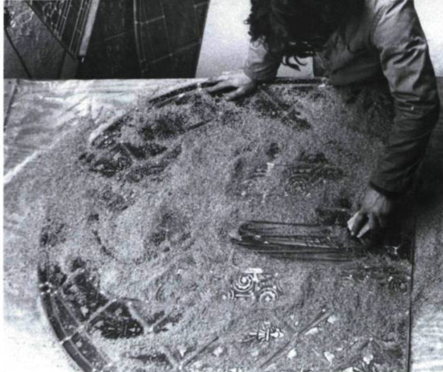
Le nettoyage à la sciure de bois.