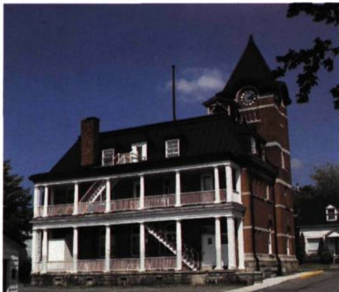
La façade arrière de l'ancien bureau de poste (1912). L'édifice est remarquable par sa tour carrée aux quatre horloges.