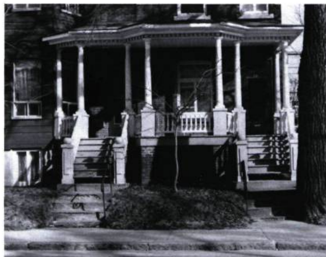
Quand la galerie sert à personnaliser un bâtiment.

Avant d'entreprendre des travaux de réparation ou de transformation d'une galerie ou d'un balcon, il convient de bien évaluer l'importance de ces éléments architecturaux. Les aspects suivants devraient être considérés: Quel rôle joue l'élément dans la définition du caractère et du style du bâtiment? Y a-t-il cohérence du langage architectural utilisé? Quelle contribution apporte-t-il dans l'équilibre des volumes de l'ensemble? Quelle est la qualité de l'espace défini par cet élément?