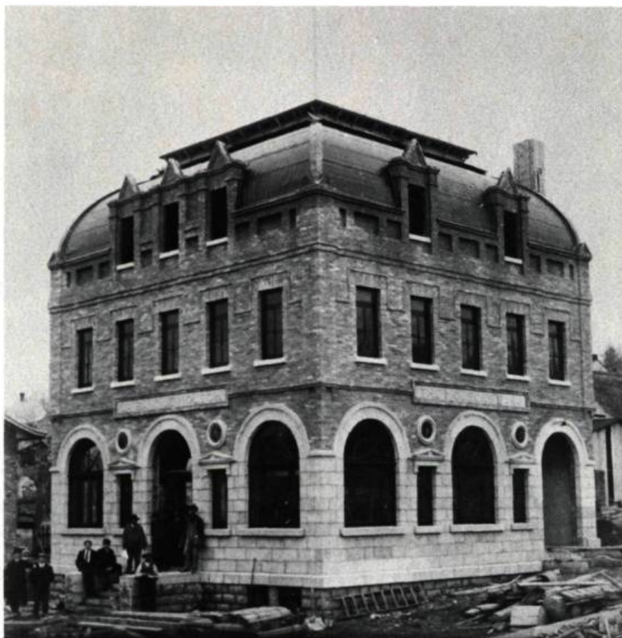
La banque Molson de Chicoutimi lors de sa construction en 1902 (René P. Lemay, arch.). Il ne subsiste aujourd'hui qu'une partie de la façade de ce somptueux édifice.

Un panorama de l'architecture au Saguenay-Lac-Saint-Jean.