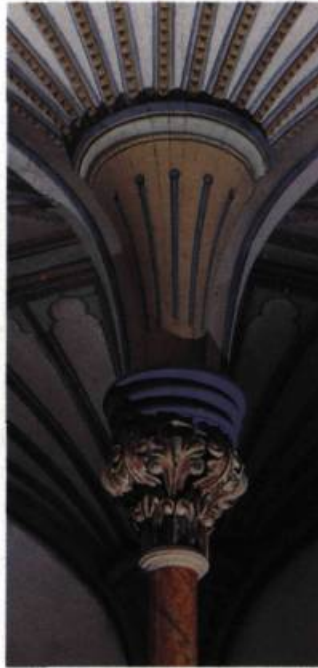
Un chapiteau et le départ d'une voûte en éventail.

Contrairement aux chapelles extérieures bien connues (celles des Ursulines, de l'Hôtel-Dieu ou du séminaire de Québec, par exemple) qui adoptent le plan ou la forme d'une église, la chapelle du couvent d'Ottawa s'inscrit dans un corps de bâtiment; elle y occupe les premier et deuxième étages, le rez-de-chaussée étant aménagé en salle de musique et le comble mansardé en dortoir. Afin de créer des espaces intérieurs bien dégagés, l'architecte utilise des colonnes pour soutenir les lambourdes de plancher. Cette disposition, employée une première fois par Thomas Baillairgé dans la chapelle de la Congrégation du séminaire de Québec en 1821, constitue à chaque étage un vaisseau principal et deux collatéraux de même hauteur, laissant ouverte toute possibilité de cloisonnement ultérieur. Emprunté à l'architecture commerciale, ce système se raffine avec l'avènement des colonnes de fonte et les structures de planchers de bois enduits: les portées plus grandes sont possibles et la protection contre le feu est accrue.