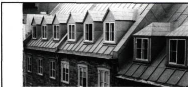
Îlot Saint-Nicolas Québec

Du 17 septembre au 2 novembre 1987, le Musée de la civilisation reçoit à la Maison Chevalier la prestigieuse collection du Museum of American Folk Art de New York. L'exposition qui circule avec grand succès en Amérique et en Europe permet un regard sur l'art populaire en tant qu'art réel et comme expression d'un pays neuf. American Folk Art: Expressions of a New Spirit , c'est au total 142 oeuvres, parmi les plus beaux objets du genre, qui viennent témoigner de cet héritage culturel fort riche et combien recherché par les collectionneurs. La Maison Chevalier est située au 60 rue du Marché Champlain, Place Royale, à Québec. L'entrée est libre. P.T.