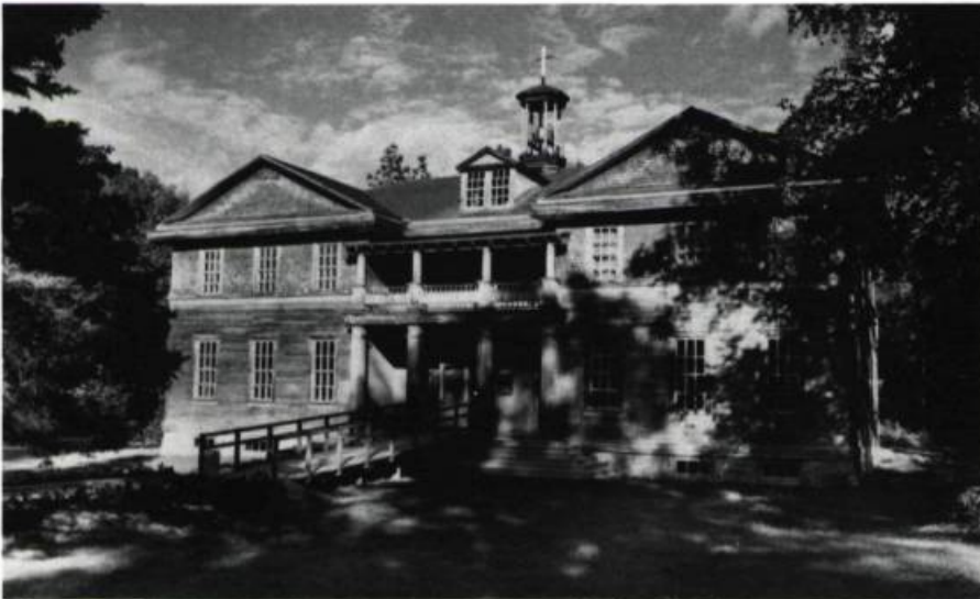
L'école construite en 1915 par l'architecte Alfred Lamontagne sert aujourd'hui de centre d'interprétation de l'histoire de Val-Jalbert. On y retrouve une superbe maquette qui présente en « son et lumière » l'aventure industrielle du village. (photo: B. Ostiguy)

Certaines maisons de la haute ville, à l'origine secteur résidentiel, ont été restaurées pour héberger les visiteurs. (photo: B. Ostiguy)