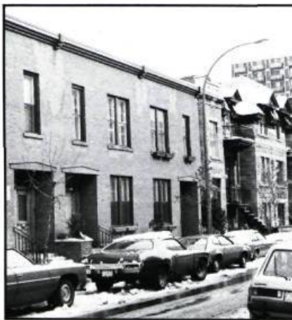
Rue Hôtel-de-Ville, au sud de la rue Prince-Arthur, ces maisons nouvellement restaurées étaient considérées comme des taudis il y a quelques années. La photo, prise un matin tranquille de semaine, laisse deviner les problèmes de stationnement aux heures d'affluence.

Supposons par exemple que l'on ait à décider de l'emplacement d'un foyer pour personnes âgées, de logements pour handicapés physiques, d'écoles primaires ou secondaires. Le choix se fera presque automatiquement en fonction du transport automobile individuel, inaccessible en